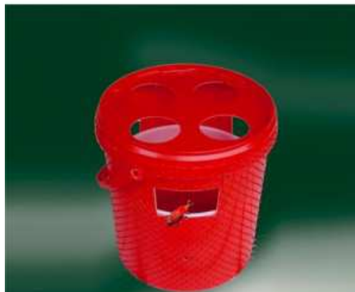
Fig. 1. Trappola a feromoni