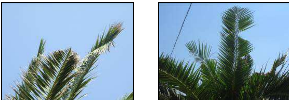
Fig. 3 Margini seghettati e rosure fogliari

I primi sintomi riscontrabili sulle palme sono l'asimmetria della chioma e la presenza di foglie spezzate o con margini seghettati.