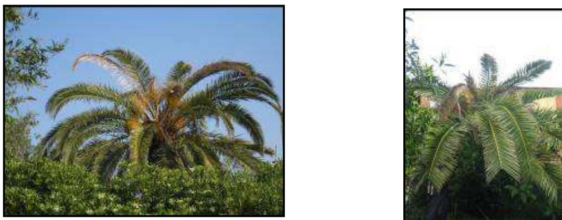
Fig. 4 Asimmetria della chioma e appiattimento

Successivamente si ha un gradiente di danno sempre più intenso con la cima che si piega e la chioma che si appiattisce. La pianta, da un'osservazione a distanza, appare come appiattita.