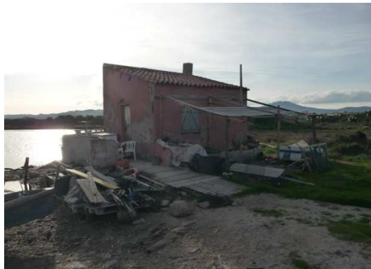
edificio esistente da riqualificare