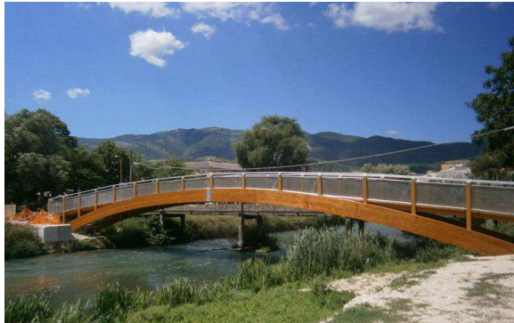
Ponte in legno tra isole e terra