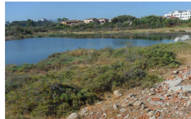
rifiuti da rimuovere